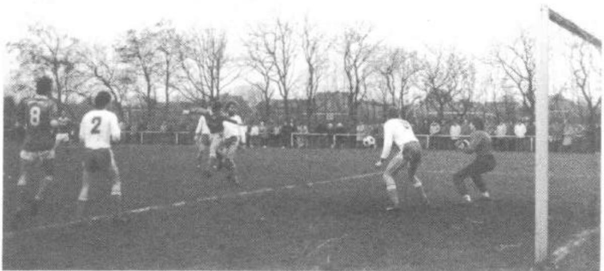
Udo Krömer erzielt mit einem Kopfball die 1 : 0 Führung im Lokalderby gegen den SV Hage