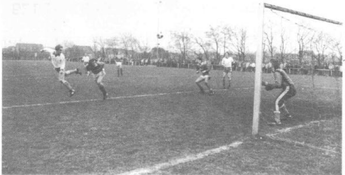
Ebenfalls per Kopf besorgt Hages Mittelfeldspieler Jörg Friesenborg den 1 : 1 Ausgleich (Endstand SV Hage-SSV 2:2)