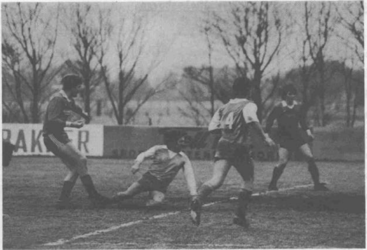
Jürgen Wäcken erzieht das 1 : 0 (oben) gegen den PSV W'haven Verständlicher Jubel in den Reihen der SSVer (unten).